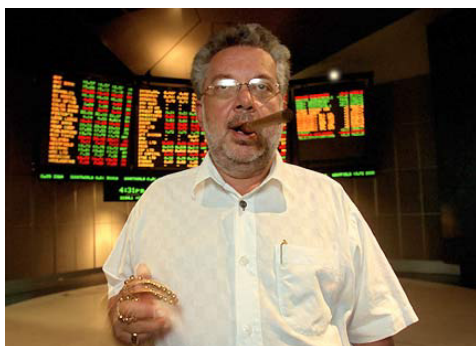
เรเน่ วอลเตอร์ เรฟกิน (Rene Walter Rivkin)

“ผมเกลียดวันสุดสัปดาห์ เพราะว่า... ตลาดปิดทำการ”